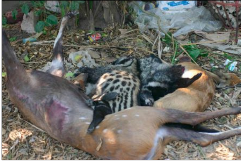
Animais mortos apreendidos aos furtivos

A caça furtiva no interior do Parque Nacional da Gorongosa (PNG) continua activa e preocupante, apesar de fortes medidas de fiscalização.