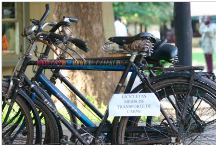
Bicicletas usadas no transporte de carne apreendidas pelos fiscais

O produto de caça tem como o destino principal o consumo e fins comerciais em pequena escala nos mercados de esquina, incluindo barracas locais, geralmente transportado à cabeça e em bicicletas.