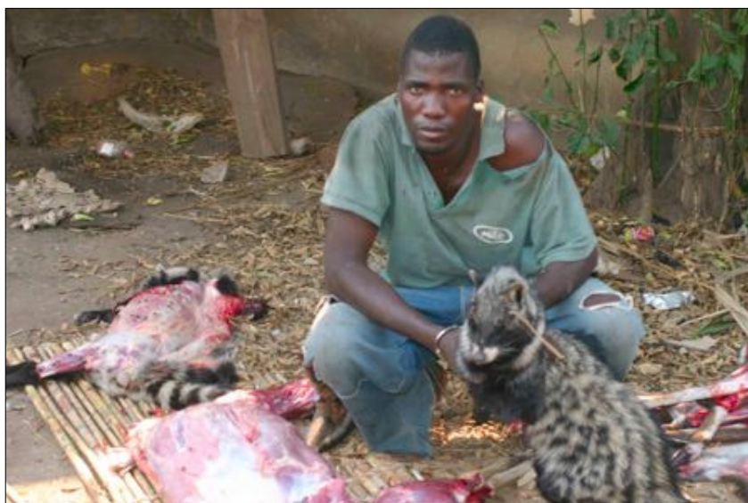
Animais mortos e esfolados pelo furtivos

A acção delituosa reduz até certo ponto várias espécies de pequeno e médio portes. As estatísticas referem entre três mil e 3.500 animais mortos por ano, com maior destaque para facoceros, changos e pivas.