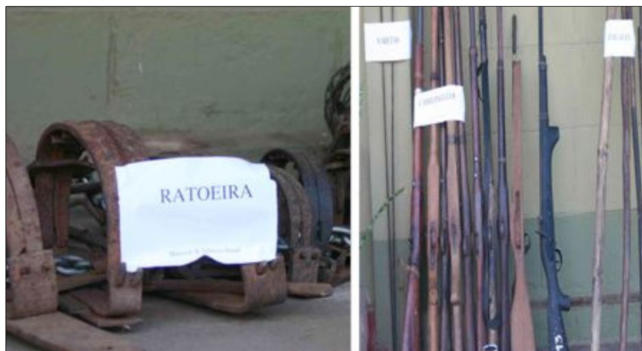
Parte de materiais apreendidos

Em 2008 foram recolhidos 2475 laços, 139 armadilhas 20 canhangulos e capturados 152 prevaricadores.